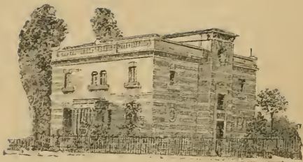
CASA SANTA TERESA *